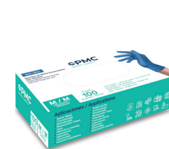
Caja individual 100 guantes